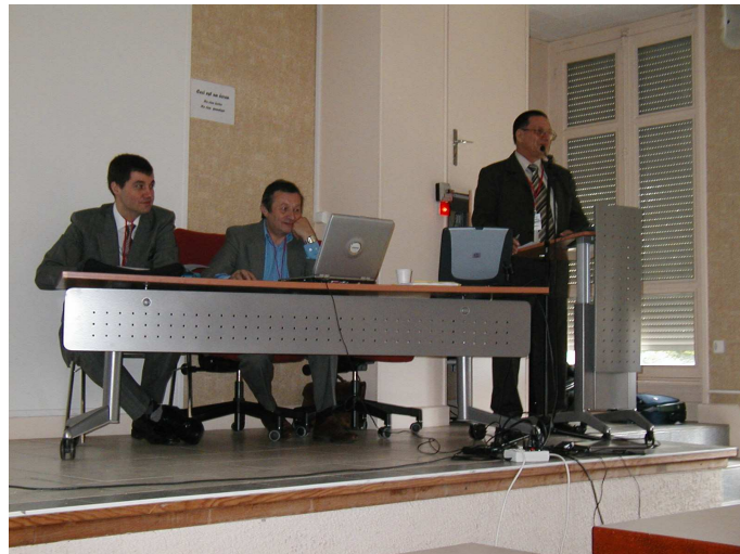
L'ouverture de l'AG par le président FGZJ

1/ Le Point du Président : En préambule et pour répondre à certaines remarques concernant le fonctionnement de l'association et notamment du conseil d'administration, le président rappelle à nouveau l'organigramme du REF-Union. Le REF est constitué statutairement de ses membres qui élisent des représentants départementaux. Ceux-ci élisent à leur tour des représentants régionaux (Drus). Ils deviendront