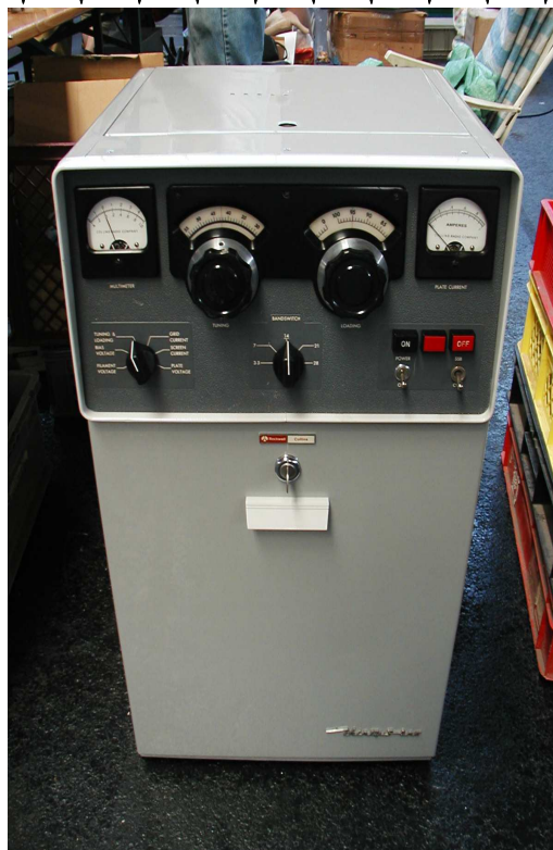
Ampli Collins 1.5Kw 2500€

Une belle piece de la brocante FRIEDRICHSHAFEN 2006