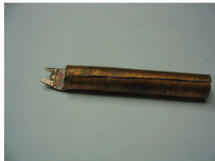
la panne fabrication OM

Si vous avez ce genre d'opération à faire, voici une panne de fer construction maison pour dessouder très rapidement un CMS. Il s'agit d'un morceau de tube de cuivre ramené au diamètre du fer à souder et une petite opération à la lime afin de faire une fourche de la taille des composants.